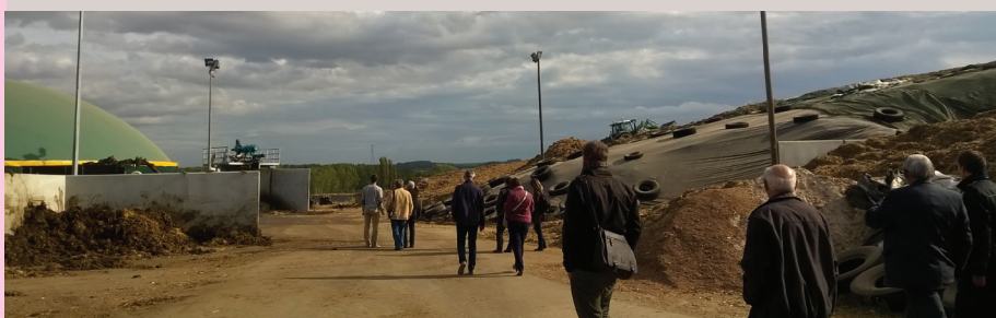
ATELIERS TERRITORIAUX ÉNERGIE/PLANIFICATION ORGANISÉS PAR LE SYNDICAT MIXTE POUR LE SCOTERS, AVEC L'APPUI DE L'ADEUS, MARS 2017

Aujourd'hui, l'exploitant continue d'être en innovation constante pour permettre le développement de l'unité de méthanisation et sa bonne intégration dans le territoire (réduction des nuisances sonores, olfactives...).