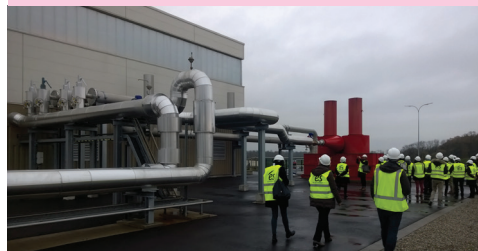
VISITE DE LA CENTRALE GÉOTHERMIQUE À RITTERSHOFFEN (PILOTÉE PAR EDF, DÉLÉGATION RÉGIONALE GRAND EST), DANS LE CADRE DE LA 38 E RENCONTRE DES AGENCES D'URBANISME À STRASBOURG, NOV. 2017

Pour assurer la réalisation et l'exploitation du projet, les trois partenaires se sont réunis au sein d'une co-entreprise dont la répartition du capital est la suivante : 40 % pour ES, 40 % pour Roquette, et 20 % pour la Caisse des Dépôts.