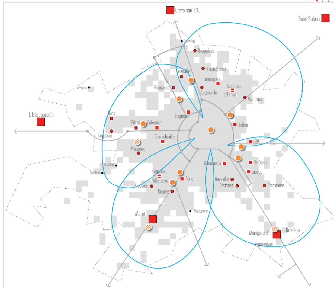
Toulouse : maillage et territorialisation des polarités