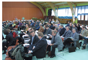
• Zones Inondables - Blaesheim - janv 03