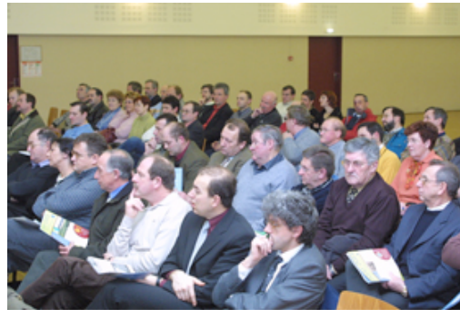
Blaesheim. - déc. 03