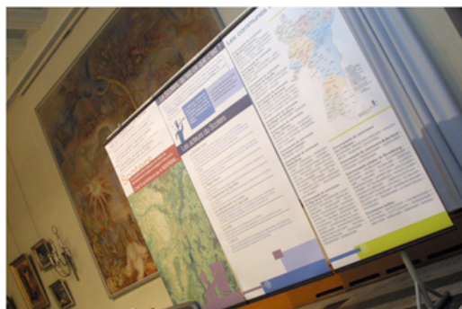
Brumath - Déc 03