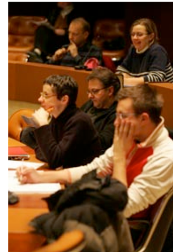
Strasbourg - fév 05