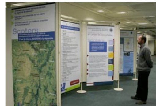
CUS - fév 05