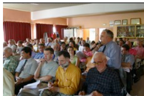
• Diagnostic Lingolsheim - juil 02