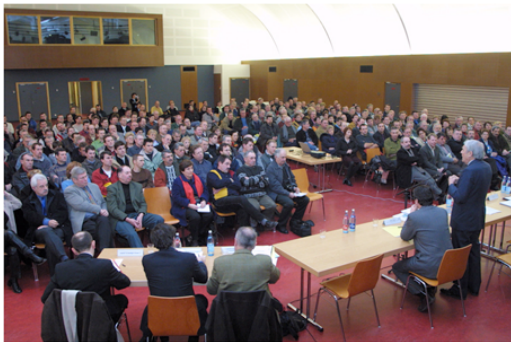
Truchtersheim - fév 03