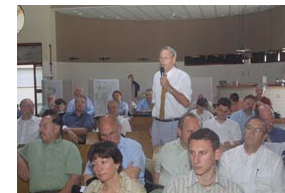
• DOG Nordhouse - mai 04