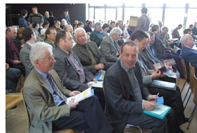
• PADD Vendenheim - mars 03